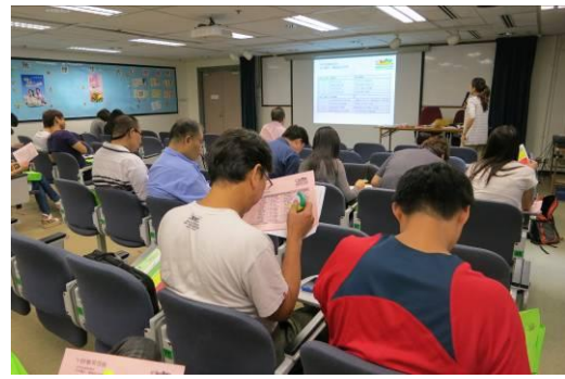
學員全神貫注聽取衛生署醫生及營養師的講解