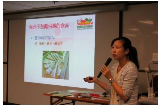
醫生及營養師講解 6-12 歲學童的營養需要