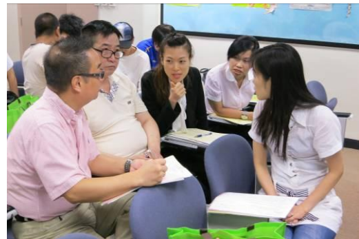
分組活動：學員分組設計健康及營養均衡食譜