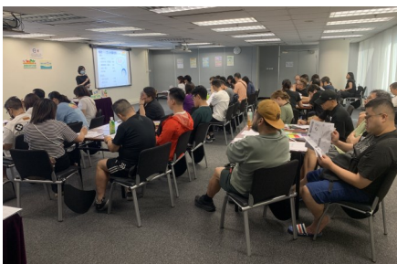
學員全神貫注聽取衛生署營養師的講解

均衡飲食對學生的成長和健康發展十分重要，能為身體健康及學習表現奠定良好基礎。除了在家中培養健康飲食習慣外，校園內的飲食環境同樣關鍵。午膳供應商及學校飯堂職員在當中肩負著重要的責任！為支援業界提升營養知識及餐單設計能力，衛生署定期舉辦「廚師營養烹調培訓工作坊」，協助他們了解學生的營養需求、掌握最新的午膳建議，並提升餐單設計和烹調技巧，從而為學生製作既健康又美味的午膳。